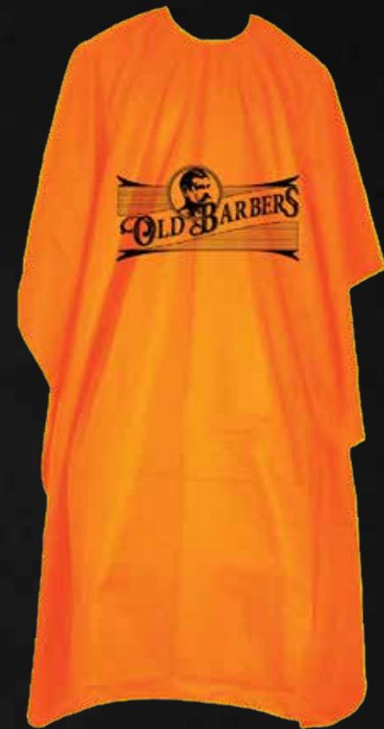
MANTELLA DA TAGLIO