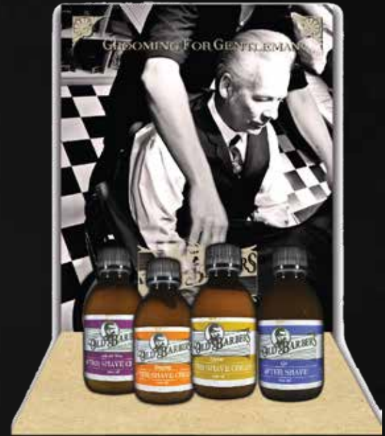
ESPOSITORE DA BANCO