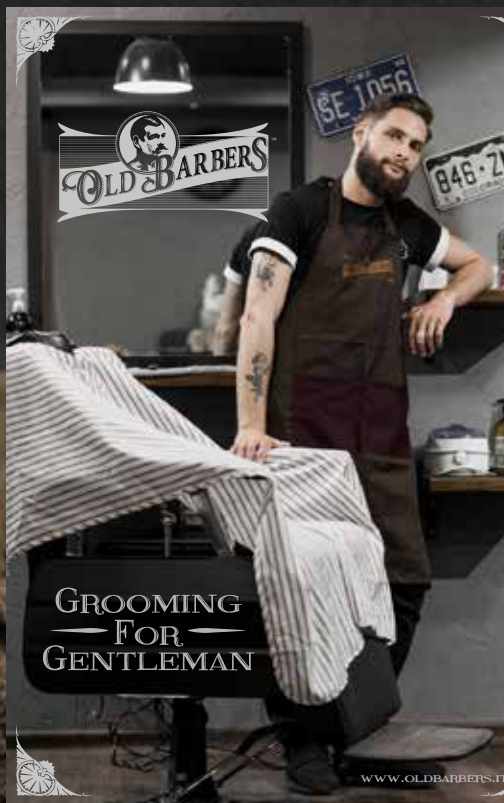
POSTER 50 X 70 CM