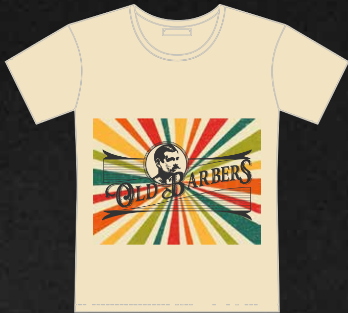
T-SHIRT OLD BARBER VARIE MISURE