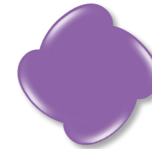
N° 7 Violet