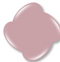
Base Nude 4