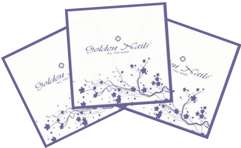
Catalogo Golden Nails Golden Nails catalogue