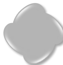
Base + Top