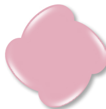
Base Nude 3