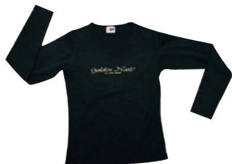
T-shirt maniche lunghe Golden Nails Golden Nails t-shirt cod. GO00207 S-M-L-XL

T-shirt nera maniche lunghe con stampa Golden Nails in cristalli swarovski. Taglie disponibili: S-M-L-XL