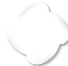
N° 1 White

New gel with an innovative formulation, very high coverage without dispersion. Perfect for any decoration!