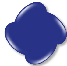
N° 4 Blue