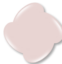
Base Nude 1