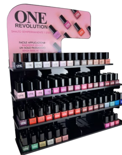
Espositore per Rivendita ONE cod. EXPO008

Espositore da banco contenente 12 colori a scelta One Revolution. Counter display containing 12 colours of your choice from One Revolution.