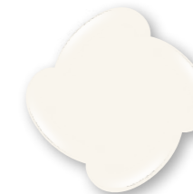
Milky Soft P447