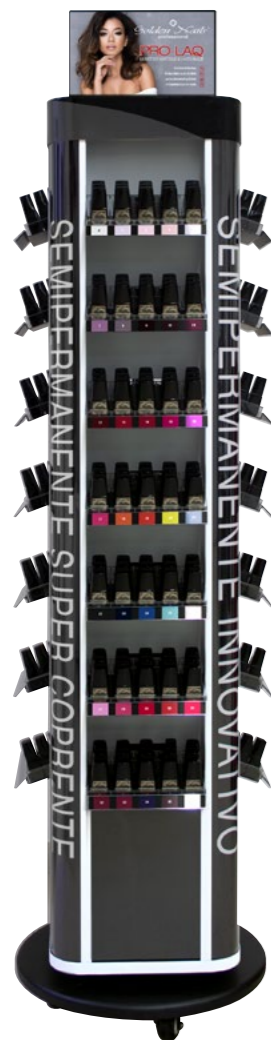
Espositore Pro-Laq cod. EXPO0037/GO

Espositore girevole contiene 420 pezzi. Revolving Display contains 420 pieces.