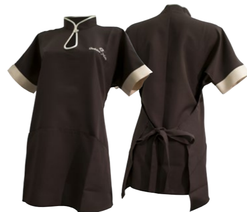
Camice modello Coreana Korean shirt