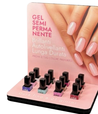
Espositore da Banco ONE cod. EXPO0066

Espositore da banco contenente 12 colori a scelta Pro-Laq. Counter display containing 12 colours of your choice from Pro-Laq.