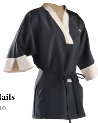
Kimono Golden Nails Golden Nails kimono cod. GO00205

Black T-shirt with the crystal Swarovski printing. Size Aviable S-M-L-XL.