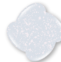
Snow Star P417