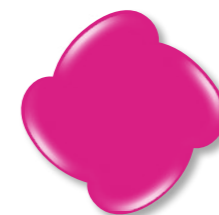
N° 3 Magenta