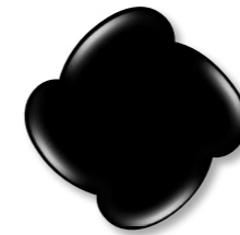
N° 2 Black