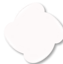
Base Nude 5