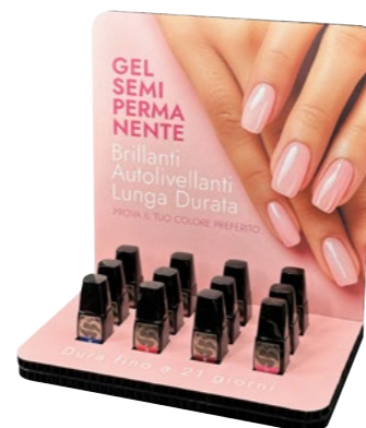
Espositore da Banco Pro-Laq cod. EXPO0066

Espositore da banco contenente 12 colori a scelta Pro-Laq. Counter display containing 12 colours of your choice from Pro-Laq.