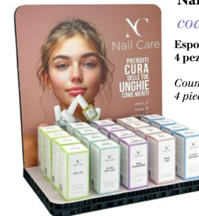
Espositore per Rivendita Nail Care cod. EXPO0070

Espositore da banco per rivendita della linea One Revolution. Countertop display for resale of the One Revolution line.