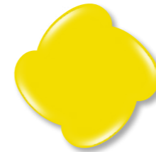
N° 5 Yellow