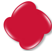
N° 8 Red