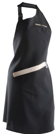
Grembiule Golden Nails Golden Nails work uniform cod. GO00203

Grembiule utilissimo, dotato di una tasca anteriore, perfetto per portare gli utensili da ricostruzione.