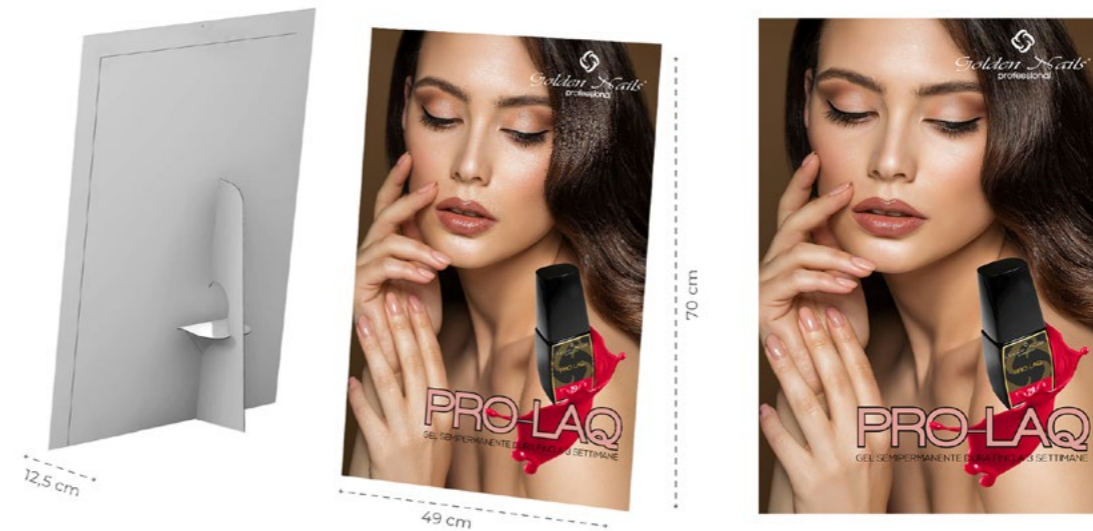
Cartello Vetrina Pro-Laq cod. CV0001/GO

Cartello vetrina da utilizzare come elemento di arredo o pubblicitario.