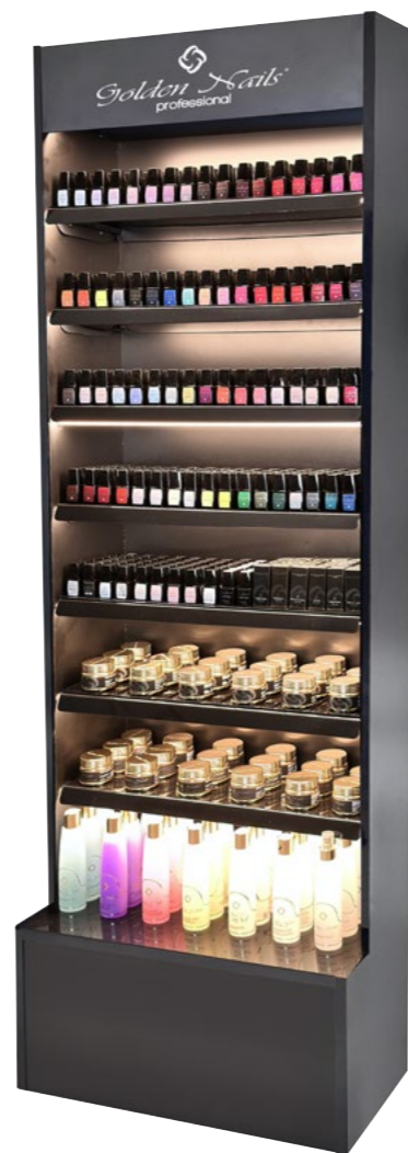
Espositore Completo cod. EXPO0050

Espositore girevole contiene 420 pezzi. Revolving Display contains 420 pieces.