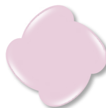
Base Nude 2