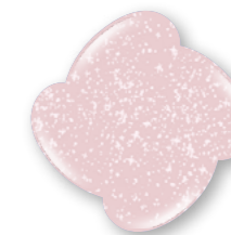
Peach Star P419