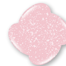
Pink Star P418