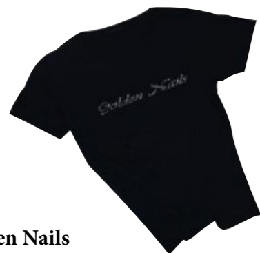
T-shirt Golden Nails Golden Nails t-shirt cod. GO00206 S-M-L-XL

Work uniform, useful with a front pocket, perfect to bring utensils reconstruction.