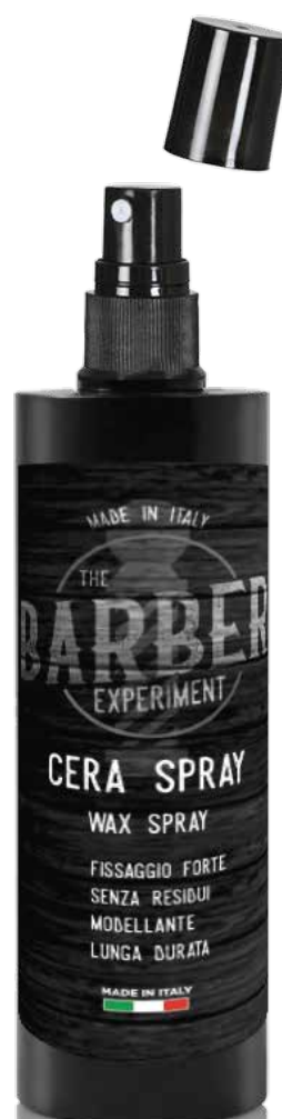
CERA CAPELLI SPRAY COD BE274 € 15,60