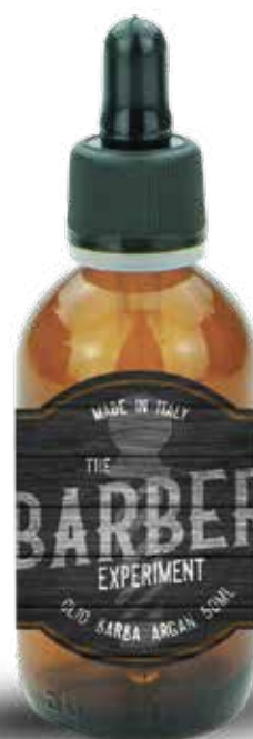
OLIO BARBA ARGAN 50 ML COD BE451 € 12,80