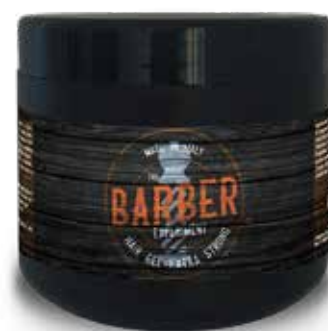
HAIR GEL WATER DG COD BE262 € 10.00