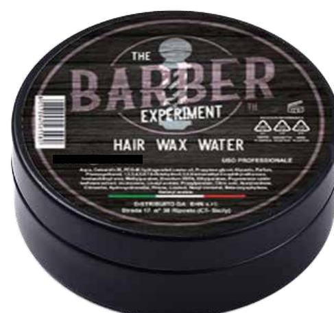
HAIR WAX WATER TH COD BE551 € 9,00