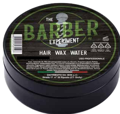
HAIR WAX WATER AV COD BE783 € 9,00

How to use: Take a small amount of wax between your fingers. Warm the wax by rubbing it between your hands. Apply it to damp or dry hair, styling as desired. You can refresh your look during the day with a little water, thanks to the water-soluble formula.