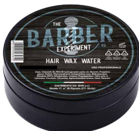
HAIR WAX WATER BB COD BE592 € 9,00