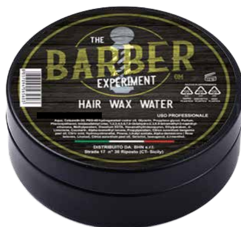
HAIR WAX WATER OM COD BE875 € 9,00