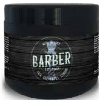
HAIR GEL WATER AG COD BE072 € 10.00

Perfect for sculpted, structured looks or for those seeking gravity-defying hold without compromise.