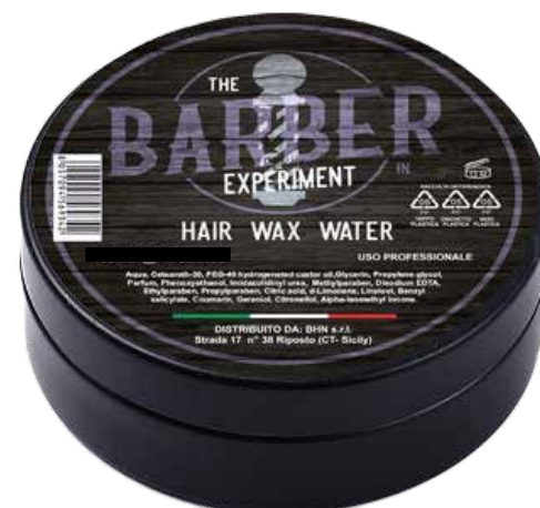
HAIR WAX WATER IN COD BE868 € 9,00