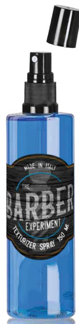
TEXTURIZER SPRAY COD BE970 € 15,60