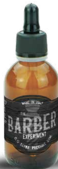
OLIO PRE SHAVE 50 ML COD BE733 € 16,80