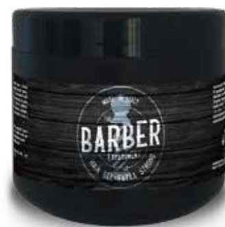
HAIR GEL WATER CK COD BE065 € 10.00