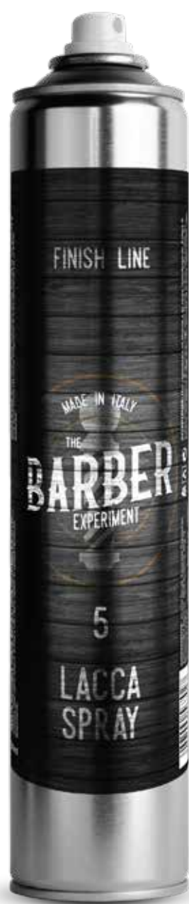
LACCA SPRAY COD BE027 € 10,20

The ecological spray hair lacquer is designed to provide a natural and flexible hold without weighing the hair down. Its gas-free composition is environmentally friendly. Perfect for setting lightweight and voluminous hairstyles while maintaining the hair's natural elasticity. Directions for use: Shake well before use. Spray from about 30 cm (12 inches) away on dry hair to set the desired hairstyle. Ideal for natural hold without leaving residue.