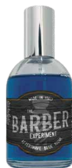
AFTER SHAVE BLUE COD BE507 € 14.00