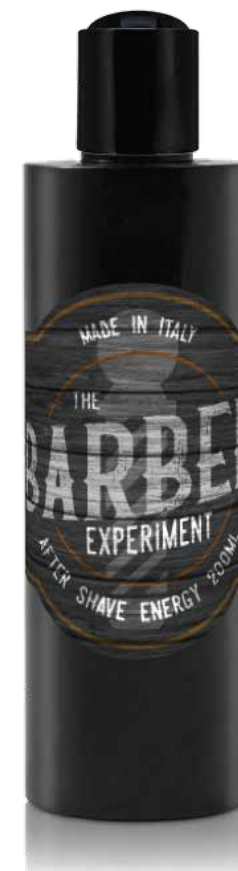
AFTER SHAVE ENERGY COD BE740 € 14.00