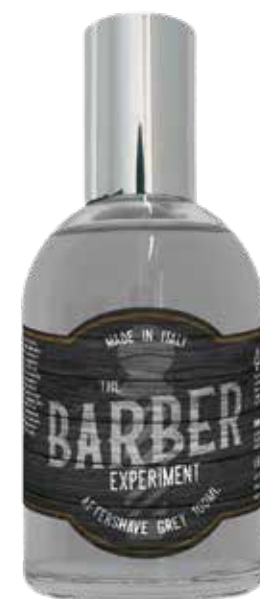
AFTER SHAVE GREY COD BE870 € 14,00