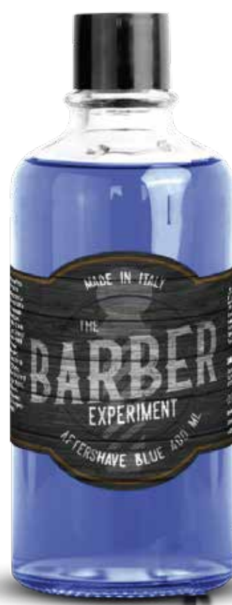
AFTER SHAVE BLUE COD BE832 € 26.00