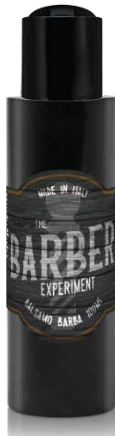
BALSAMO BARBA 100 ML COD BE788 € 12,00

Il pre-shave è un prodotto ideato per preparare la pelle alla rasatura, ammorbidendo i peli e creando una barriera protettiva per evitare irritazioni e tagli. Formulato con oli nutrienti e idratanti, come l'olio di ricino e l'olio di mandorle, facilita lo scorrimento della lama, rendendo la rasatura più confortevole e precisa. Modo d'uso: Applicare una piccola quantità di pre-shave sulla pelle umida e massaggiare delicatamente prima di applicare il gel, la crema o la schiuma da barba. Procedere quindi con la rasatura.