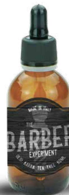
OLIO BARBA TEA TREE 50 ML COD BE281 € 12,80