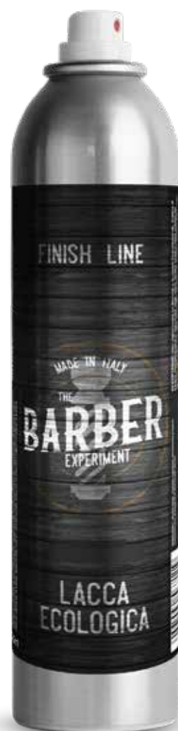
LACCA ECOLOGICA COD BE119 € 16,40