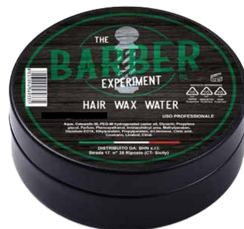
HAIR WAX WATER DG COD BE776 € 9,00