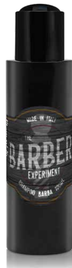
SHAMPOO BARBA 100 ML COD BE801 € 7,60