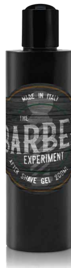
AFTER SHAVE GEL COD BE771 € 14.00