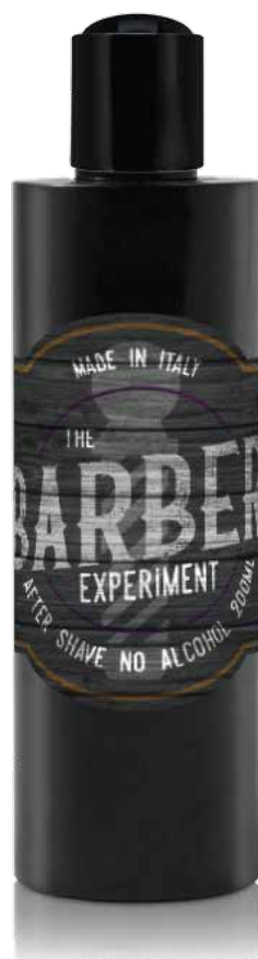
AFTER SHAVE NO ALCOHOL COD BE764 € 14.00

The gel after shave is designed to soothe and refresh the skin after shaving, featuring key ingredients like Aloe Vera and chamomile extract, known for their calming properties. The gel has a lightweight texture that absorbs quickly, while natural menthol and carbomer provide a pleasant cooling sensation. Directions for Use: Apply a small amount of gel to freshly shaved, dry skin. Gently massage until fully absorbed. Ideal for daily use.