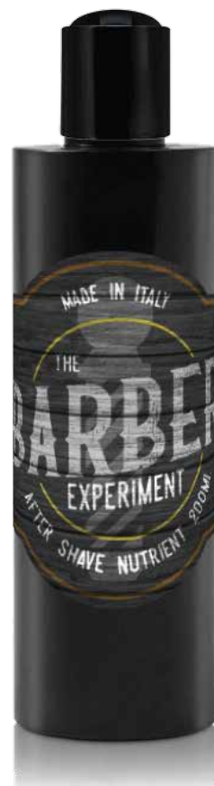
AFTER SHAVE NUTRIENTE COD BE757 € 14.00