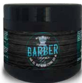
HAIR GEL-WAX AS COD BE532 € 10.00