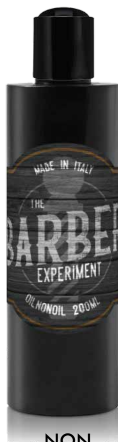
OIL NON OIL COD BE878 € 12,00

The spray wax is a versatile hair styling product designed to provide hold and control with a natural, lightweight finish. Directions for Use: Shake well before use. Spray evenly on dry or damp hair from a distance of about 20-30 cm, then style with your hands or a comb to achieve the desired look.