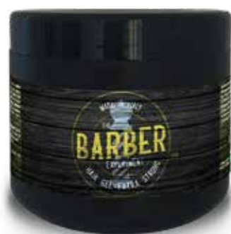
HAIR GEL WATER OM COD BE255 € 10.00